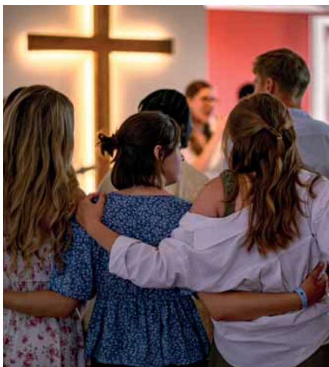
YOUNITED – Gemeinschaft und Zusammenhalt im Gottesdienst

Ein weiterer wichtiger Bestandteil der Arbeit war das Pfadfinder:innenlager „SteWa“, das unter dem thematischen Leitgedanken „Auch dann“ stand und sich inhaltlich an der biblischen Geschichte von Esther orientierte. Über mehrere Tage lebten die Teilnehmenden gemeinsam im Zeltlager und setzten sich altersgerecht mit Fragen von Mut, Verantwortung und Zusammenhalt auseinander. Das Thema wurde durch gemeinsame Aktionen, Spiele und kreative Elemente aufgegriffen. Neben der inhaltlichen Arbeit förderte das Lager insbesondere Gemeinschaft, Selbstständigkeit und soziale Kompetenzen. Das gemeinsame Leben im Lageralltag stärkte den Zusammenhalt und ermöglichte intensive Gruppenerfahrungen.