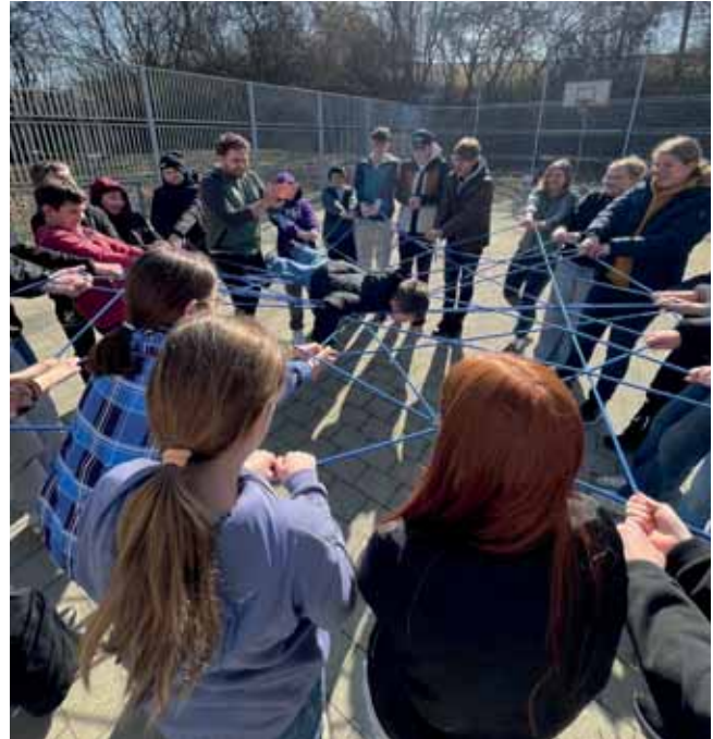
Kooperationsübung im Rahmen der Winterfreizeit in Haidenaab

aber auch Sorgen und Nöte gesammelt. Damit eröffneten wir die Möglichkeit, Jugendliche in die kommunalpolitische Willensbildung ihrer Gemeinde einzubinden.