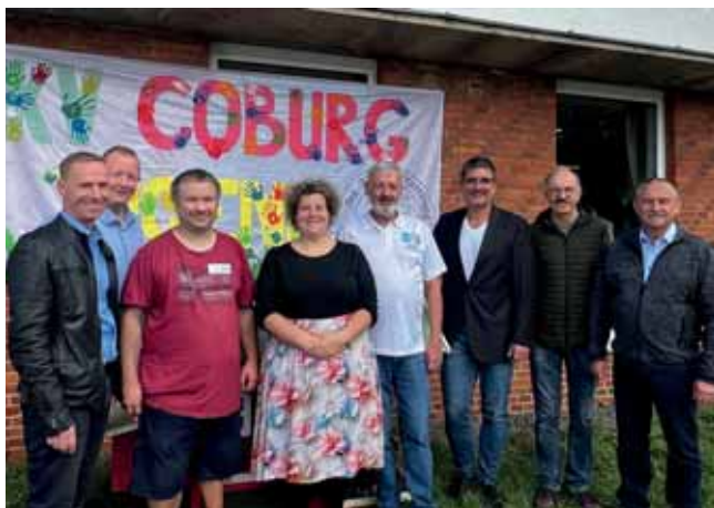
Vertreter:innen aus Politik und Verband machten sich am „Tag des Kaninchens“ ein Bild

Die Jungen Tierfreunde sind die eigenständige Jugendorganisation des Verbands Bayerischer Rassekaninchenzüchter e. V. In der Bezirksjugend Oberfranken unterstützen wir die Kreis- und Ortsjugendleiter:innen und koordinieren sowie organisieren kreisübergreifende Veranstaltungen.