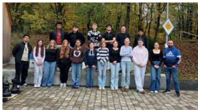
Schüler:innen am CourageCoach

In der Jugendbildungsstätte Neukirchen kam es zu personellen Veränderungen, wodurch sich auch Zuständigkeiten innerhalb der Kooperation verschoben. Die Zusammenarbeit konnte 2025 jedoch gut neu strukturiert werden und hat sich mittlerweile erfolgreich eingespielt, sodass die bewährte und verlässliche Kooperation weiterhin erfolgreich fortgeführt wird.