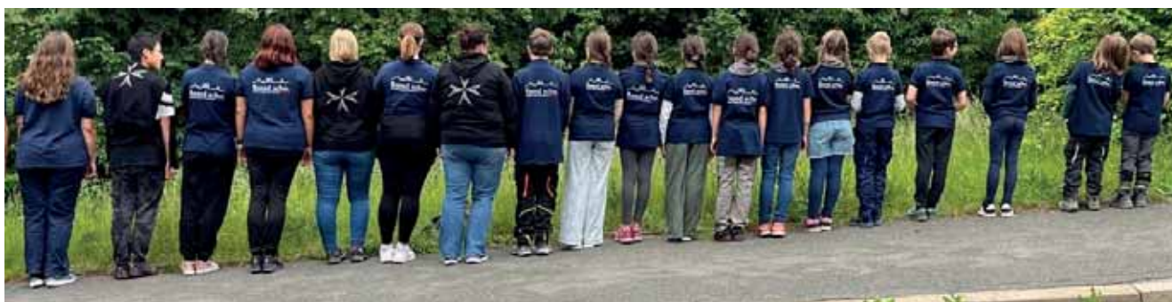
Gruppenbild der Malteser Jugend