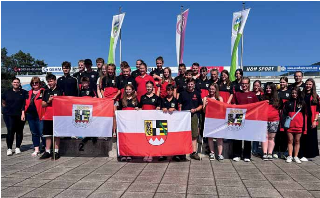
Oberfränkischer Kader zum Bayernpokal 2025

Die Bezirksjugendleitung des Schützenbezirks Oberfranken kümmert sich in erster Linie um die Durchführung sportlicher Ereignisse sowie weiterbildende Maßnahmen im Jugendbereich des Schießsports. Aktuell umfasst der Schützenbezirk 5.930 Jugendliche.