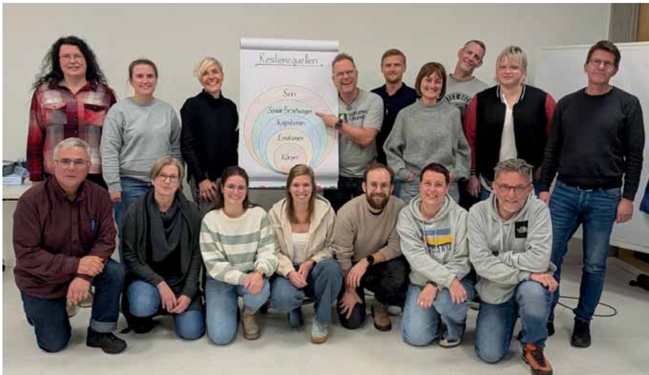
KoJa-Herbsttagung im BLSV Sportcamp Nordbayern in Bischofsgrün

Im Rahmen der Frühjahrstagung der Kommunalen Jugendpfleger:innen stand zunächst die U18-Wahl im Mittelpunkt. Unter dem Leitgedanken „Nach der Wahl ist vor der Wahl“ wurden die Ergebnisse der Bundestagswahl intensiv analysiert und ihre Bedeutung für die zukünftige Jugendarbeit diskutiert.