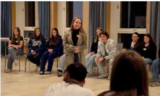
Warm-up beim SMV-Bezirksseminar 2025

Nachdem wir die zwei verabschiedeten, kümmerte sich die Spielgruppe des Leitungsteams, welches aus etwa 18 Schüler:innen bestand, um ein buntes und amüsantes Programm zum weiteren Kennenlernen und Stärken des Teamgeists. Daraufhin kamen wir in Kleingruppen zusammen und erarbeiteten Kooperationsstrategien und Vernetzungsmethoden, welche dann in einer kleinen Präsentationsrunde vorgestellt wurden. Nach einem produktiven Abend kamen wir gegen 22 Uhr zum Tagesabschluss und Programmende.