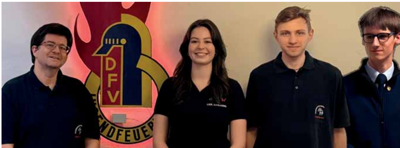
Wahl der Jugendsprecher:innen

Das Jahr 2025 war für die Jugendfeuerwehr Oberfranken von wichtigen personellen Weichenstellungen, starken Veranstaltungen und einer gezielten Weiterentwicklung der Beteiligungsstrukturen geprägt.