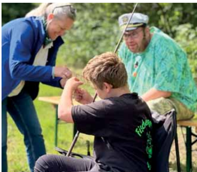
Inklusionsfischen in Bad Weißenstadt

Am Sonntag, den 25. Mai 2025, veranstalteten wir ein herzliches und inklusives Angelerlebnis. Es trafen sich 35 Teilnehmer:innen. Eingeladen waren junge Erwachsene der Lebenshilfe Fichtelgebirge sowie Kinder mit besonderem Förderbedarf aus einem integrativen Kindergarten. Ziel der Veranstaltung war es, Berührungängste abzubauen, Gemeinschaft zu fördern und allen Menschen – unabhängig von ihren Fähigkeiten – die Faszination des Angelns näherzubringen.