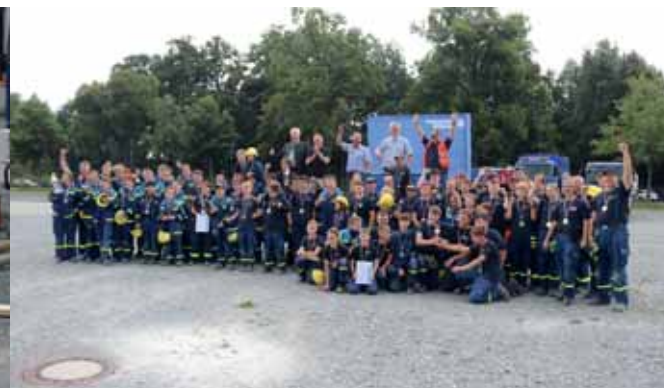
Bezirksjugendwettkampf in Bayreuth (links) mit Gruppenfoto nach der anschließenden Siegerehrung (rechts)