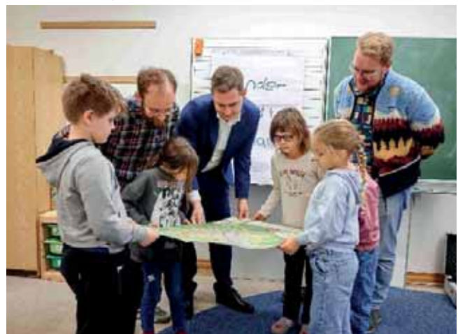
Kinder begutachten den neu aufgelegten Bamberger Kinderstadtplan