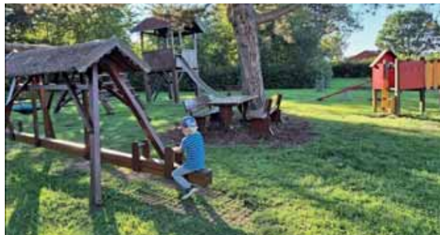
Spielplätze wurden nach der Winterpause instand gesetzt

Die Gemeinde Oberkotzau organisiert seit Jahren ein gemeindliches Ferienprogramm. Viele Vereine und Organisationen betei-