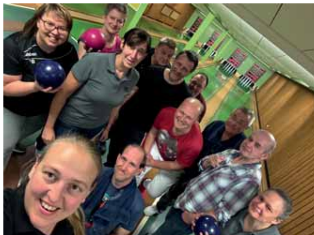
Mannschaft bei den „Gut Holz Open“

Ein zentraler Schwerpunkt der Arbeit der Sportjugend blieb auch 2025 die Aus- und Fortbildung qualifizierter Übungsleiter:innen. Über das gesamte Jahr verteilt fanden zahlreiche Lizenzverlängerungslehrgänge in ganz Oberfranken statt. Die Themenvielfalt reichte von „Military Fitness“ in Bamberg über „Plitsch, platsch, alles nass“ in Steinbach am Wald, „Outdoor“ im Fichtelgebirge, „Erlebnispädagogik“ in Lautertal bis hin zu Kommunikation und Achtsamkeit in Coburg und vielen weiteren Veranstaltungen. Diese Angebote stießen auf große Resonanz und tragen maßgeblich zur Qualitätssteigerung im Sportbetrieb bei.