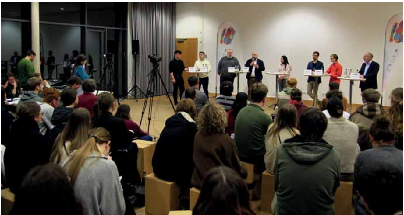
Jugenddebatte zur Bundestagswahl