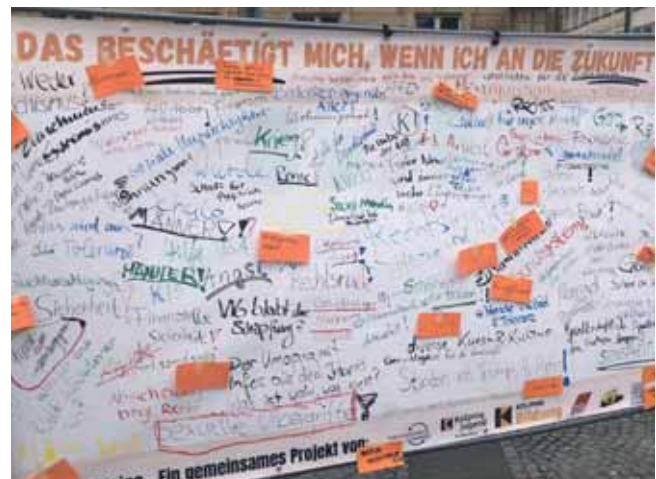
Plakat „Das beschäftigt mich, wenn ich in die Zukunft denke“