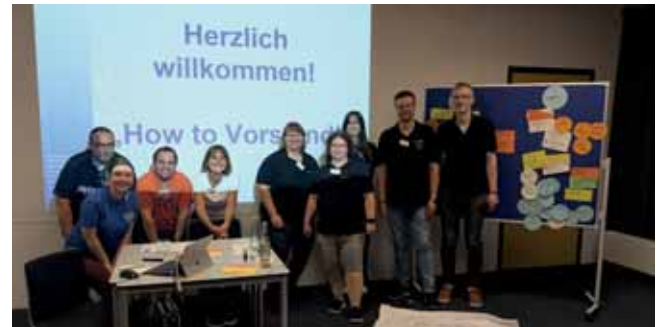
How to Vorstand

Unsere Standards konnten auch 2025 sichergestellt werden. Dazu gehören beispielsweise Beratungen und die Kontingentbewirtschaftung von Fördermitteln der Landesebene, Stellungnahmen für die Oberfrankenstiftung und Zuschussbearbeitung von Anträgen aus Mitteln der Oberfrankenstiftung.