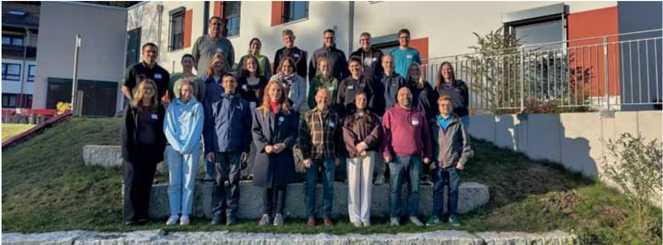
Teilnehmende bei der Kirchenkreiskonferenz in Bad Weißenstadt

Die Evang. Jugend in Oberfranken hat sich bei ihrer Kirchenkreiskonferenz mit dem Thema „Blickst du durch und baust du mit? – an der Kirche und der Evang. Jugend von heute und morgen“ beschäftigt. Die Evang. Kirche befindet sich gerade in herausfordernden Umbrüchen: weniger Ressourcen, weniger Personal usw. Da braucht es auch neue Strukturen. Regionalgemeinden sollen entstehen. Dekanate und Kirchenkreise fusionieren, um nur einige Beispiele zu nennen.