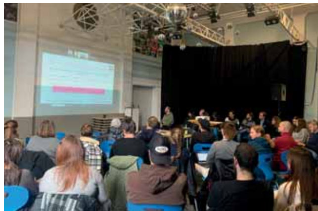
Herbstfachtagung der OKJA & gem. Jugendpflege in Oberfranken

Die Herbstfachtagung im Oktober schloss an das Prinzip der Frühjahrstagung an. Es wurden beginnend Konsumtrends von Jugendlichen in den Fokus genommen und anschließend im Plenum besprochen und nachbereitet.