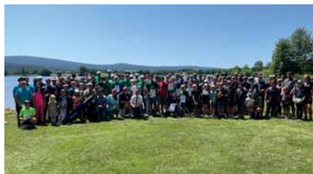
Gruppenfoto Jugendausbildungszeltlager Bad Weißenstadt

Das Highlight war wieder unser dreitägiges Zeltlager. Diesmal ging es nach Bad Weißenstadt. Bei besten Bedingungen konnten die Zelte aufgebaut und gleich mit dem Wissenstest und dem Castingwettbewerb begonnen werden. Danach ging es zum Fischen an den See. Für das Königsfischen mussten die Jugendlichen früh aufstehen, was sich aber auch gelohnt hat, denn