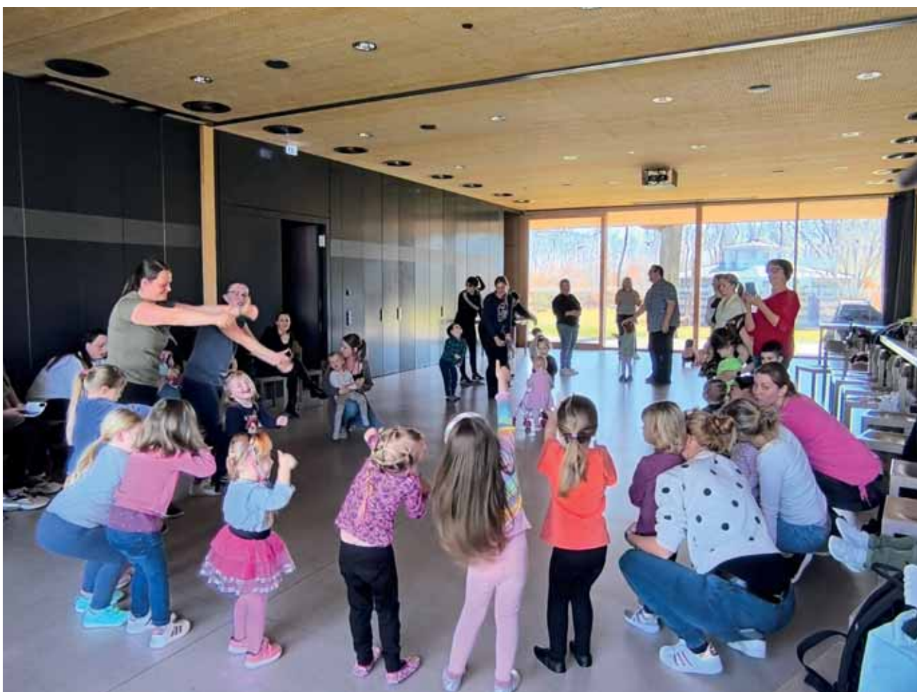
Unsere Kindertanzgruppe im Einsatz