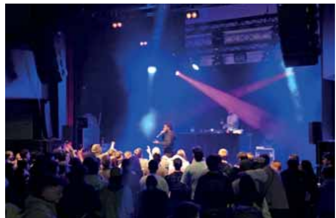
Veranstaltung „Laut für Demokratie“

Ein besonderer Höhepunkt war das am 11. Oktober 2025 erstmals durchgeführte Jugendfestival im ZENTRUM. Unter dem Motto „Laut für Demokratie“ wurden Kultur und politische Bildung auf innovative Weise miteinander verbunden. Rund 300 Besucher:innen erlebten neben Live-Musik interaktive Stationen wie einen Demokratie-Escape-Room zur Kommunalpolitik oder die Democracy Machine, die spielerisch Diskussionskultur und demokratische Kompetenzen vermittelte.