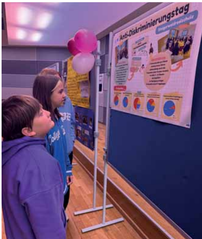
Gallery Walk der Schulprojekte im Netzwerk

Den Abschluss bildete eine Präsentation der Workshopergebnisse sowie ein gemeinsamer Ausblick. Das große Interesse, die aktive Beteiligung und die intensiven Diskussionen zeigten deutlich, wie wichtig die Relevanz des Formats für die Courage-Schulen in Oberfranken im Netzwerk ist. Das Netzwerktreffen 2025 war geprägt von Offenheit und dem gemeinsamen Wunsch, Schule als demokratischen Lern- und Lebensraum aktiv zu gestalten.