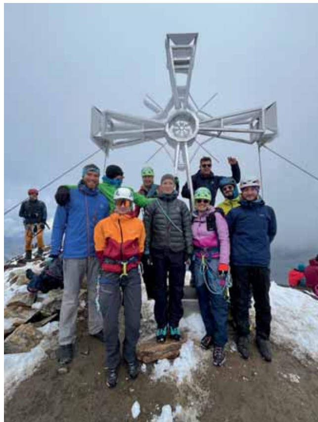
Ein weiterer Gipfel im Rahmen der Hochgebirgsdurchquerung 2025 ist erreicht