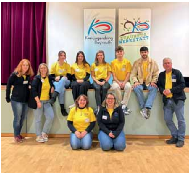
KJR-Team Zukunftswerkstatt Bischofsgrün

Neben zahlreichen Freizeit- und Bildungsangeboten fanden wieder zwei Zukunftswerkstätten statt. Bei dem niedrigschwelligen Beteiligungsangebot wurden mit jungen Menschen ab 12 Jahren in Glashütten und Bischofsgrün Wünsche und Vorschläge,