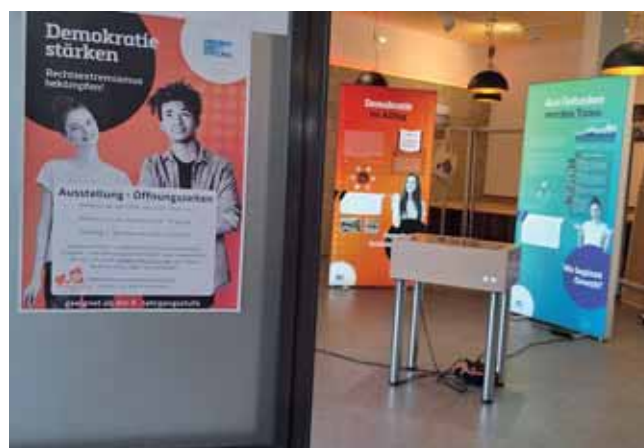
Erstmals in Forchheim: Ausstellung „Demokratie stärken – Rechtsextremismus bekämpfen“

Mit der erstmaligen Durchführung dieser Ausstellung in Forchheim konnte ein wichtiger Beitrag zur Sensibilisierung für demokratische Werte und zur Stärkung des gesellschaftlichen Bewusstseins gegen Rechtsextremismus geleistet werden. Die durchweg positive Resonanz unterstreicht die Relevanz entsprechender Bildungsformate.