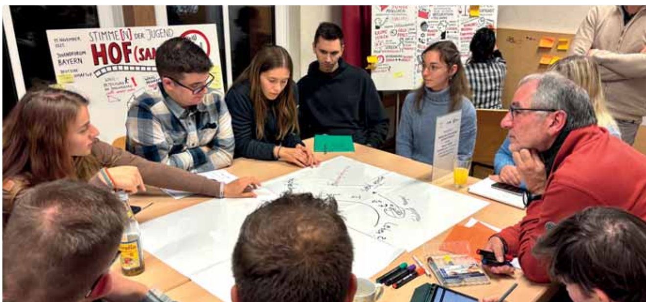
Jugendforum im Kinder- und Jugendzentrum Q in Hof

Pädagogische Mitarbeiterin SOR-SMC Ansprechpartnerin