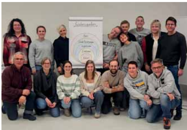
Herbsttagung Kommunale Jugendpfleger:innen

Herbsttagung, 17.-18. November, Bischofgrün