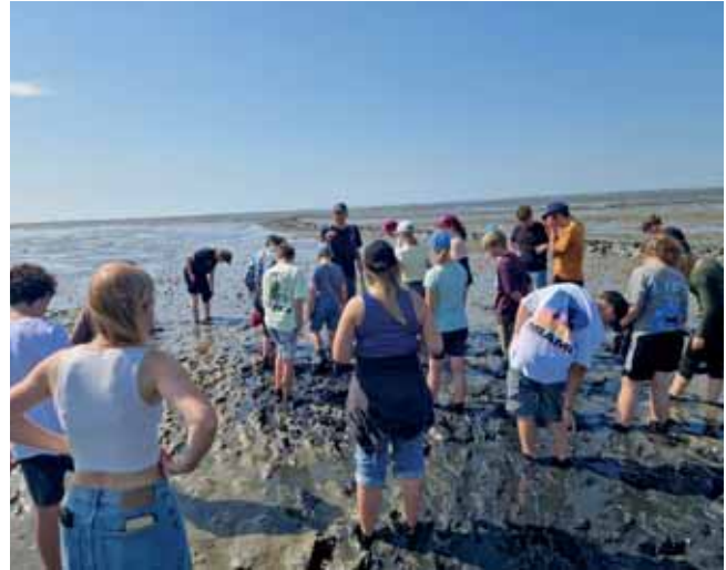
Wattwanderung auf Sylt