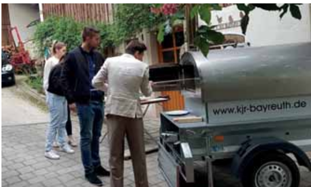
Austausch mit den jugendpolitischen Sprecher:innen bei Pizza & Politics

Gemeinsam mit Vertreter:innen der Jugendorganisationen von JU, JFW, GJ, Jusos und Julis haben wir den Pizzaofen angeheizt, Teig ausgerollt und leckere Kreationen gebacken. Doch neben dem kulinarischen Teil stand vor allem das Kennenlernen im Mittelpunkt. In lockerer Atmosphäre kamen engagierte junge Menschen ins Gespräch, teilten ihre politischen Motivationen und berichteten von ihrem Engagement vor Ort oder ihrem Weg in die Politik.