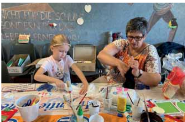
Künstlerische Kreativität wird gefordert beim Malen und Basteln

Die Jungen Tierfreunde Oberfranken trafen sich zu Beginn des vergangenen Jahres zu einem Kreisjugendleiter:innentag in Kulmbach. Dort wurde auf das zurückliegende Jahr und dessen Ereignisse geblickt sowie das Jahr 2025 besprochen. Zusätzlich haben wir uns zu unserem jährlichen Erfahrungsaustausch zusammengefunden. In einer gemütlichen und ungezwungenen Runde haben wir dort über die Jugendarbeit in den einzelnen Kreisen gesprochen und unsere Ideen für Veranstaltungen und Aktionen auf Kreisebene ausgetauscht. Unsere Abschlusstagung fand dann Ende September 2025 statt. An dieser haben wir die letzten Feinheiten zur anstehenden Bezirksschau besprochen.