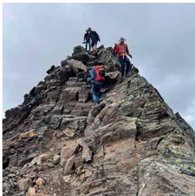
Ausgesetzte Gratpassage bei der Hochgebirgsdurchquerung 2025