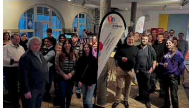
Die Veranstaltung „Ende der Eiszeit – Politiker tauen auf“

Anschließend hatten die Teilnehmer:innen die Gelegenheit, selbst Hand anzulegen und ein eigenes Canva-Projekt zu erstellen. Die Ergebnisse waren beeindruckend, und die Teilnehmer:innen konnten ihr neu erlerntes Wissen direkt anwenden.