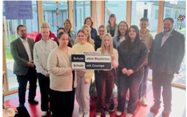
Schulzentrum der bfz gGmbH Bamberg-Coburg