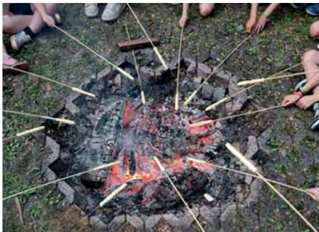
Lagerfeuer und Stockbrot bei der Kinderfreizeit