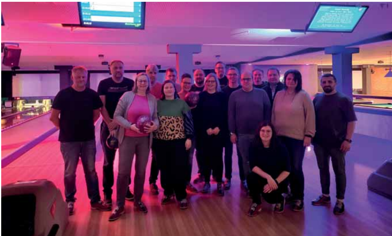
Teilnehmende beim After-Work-Bowling