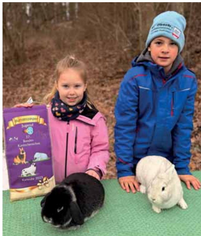
Zwei Züchter:innen präsentieren ihren Bundessieger

Das Highlight im vergangenen Zuchtjahr war die Bezirksschau in Thurnau. Hier konnten die Jungen Tierfreunde aus Oberfranken glänzen. 30 Jungzüchter:innen aus Oberfranken zeigten dem interessierten Publikum knapp 200 Tiere. Durch die gute Qualität ihrer Zuchtarbeit konnten die Jugendlichen zahlreiche Preise erringen. Einige Züchter:innen aus Oberfranken zeigten ihre Tiere auch auf der Bundesschau in den Messehallen in Karlsruhe. Auch dort konnten viele Preise mit nach Hause genommen werden.