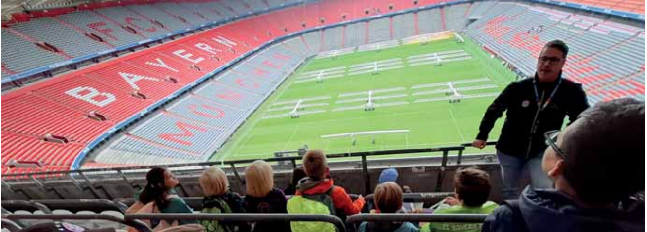
Ausflug in die Allianz Arena im Rahmen des Sommerferienprogramms

Das Jahr 2025 war für den Kreisjugendring Kronach in besonderer Weise von strukturellen Herausforderungen geprägt. Seit November 2024 verfügt der Kreisjugendring über keine:n Vorsitzende:n sowie keine:n stellvertretende:n Vorsitzende:n. Die Vorstandschaft besteht derzeit ausschließlich aus vier Beisitzer:innen. Diese außergewöhnliche Situation stellte sowohl an die interne Organisation als auch an die Zusammenarbeit mit unseren Mitgliedsverbänden und kommunalen Partner:innen erhöhte Anforderungen.