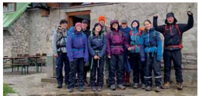
Die Wandergruppe aus zehn jungen Menschen erreicht die Berghütte