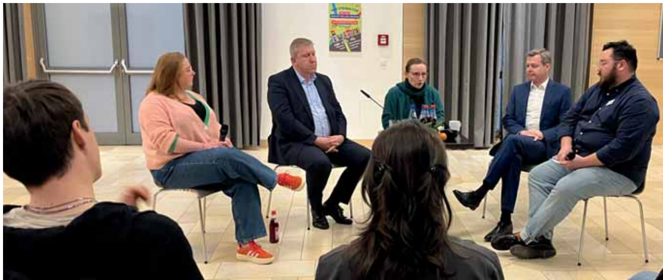
Der BDKJ im Austausch mit Mitgliedern des Bundestags während seiner Diözesanversammlung