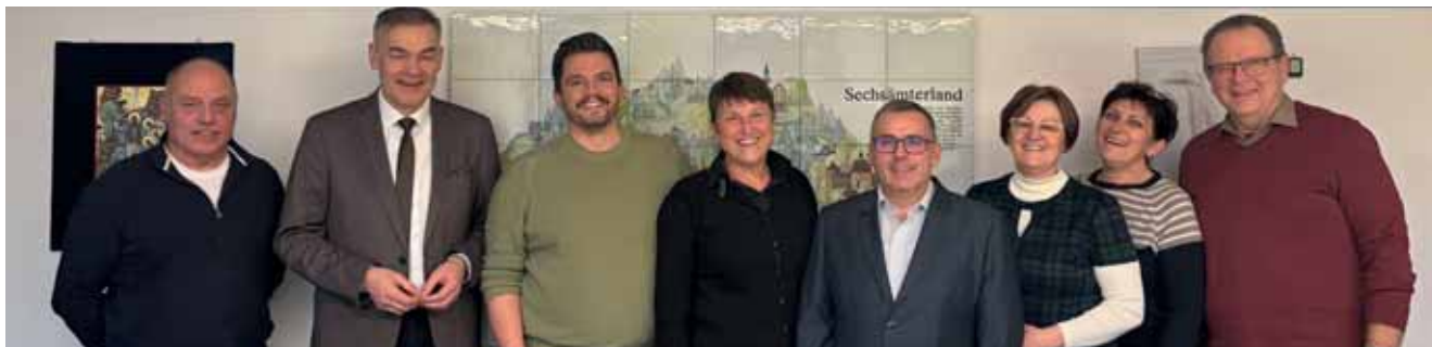
Treffen mit den Delegierten aus Ungarn

Das Jahr 2025 war für den Kreisjugendring Wunsiedel ein Jahr der Weiterentwicklung und Weichenstellung. Neben der Umsetzung bewährter Angebote prägten insbesondere strukturelle Veränderungen, strategische Abstimmungen und internationale Kontakte unsere Arbeit.