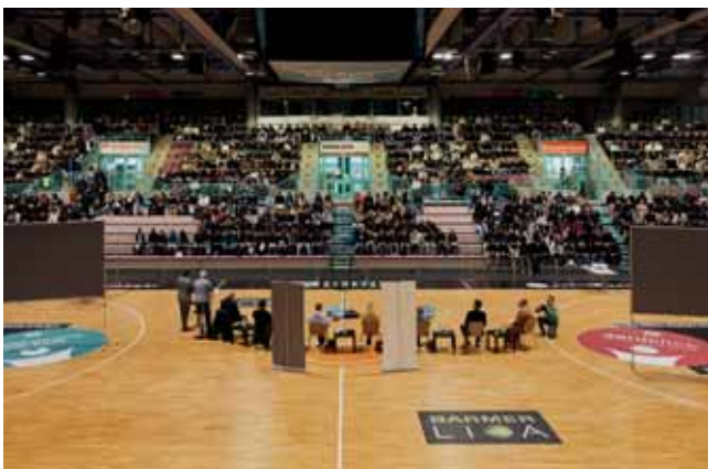
Podiumsdiskussion zur U18-Wahl in Bayreuth

Ein zentrales Thema zum Jahresbeginn war die Förderung der politischen Bildung angesichts der vorverlegten Bundestagswahl. In Kooperation mit dem Kreisjugendring Bayreuth und regionalen Medienpartner:innen organisierte der Stadtjugendring in kürzester Zeit zwei vollbesetzte Podiumsdiskussionen sowie mehrere Angebote zur U18-Wahl. Aufgrund der überwältigenden Resonanz der Schulen musste die geplante Podiumsdiskussion kurzfristig vom ZENTRUM in die Oberfrankenhalle verlegt werden. Dort diskutierten über 1.100 Schüler:innen mit den Direktkandidat:innen des Wahlkreises über Kernthemen wie Bildung, Klimaschutz, soziale Gerechtigkeit und Zukunftsperspektiven.