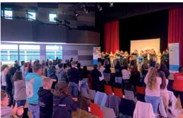
Das Theater thevo e. V. in Aktion