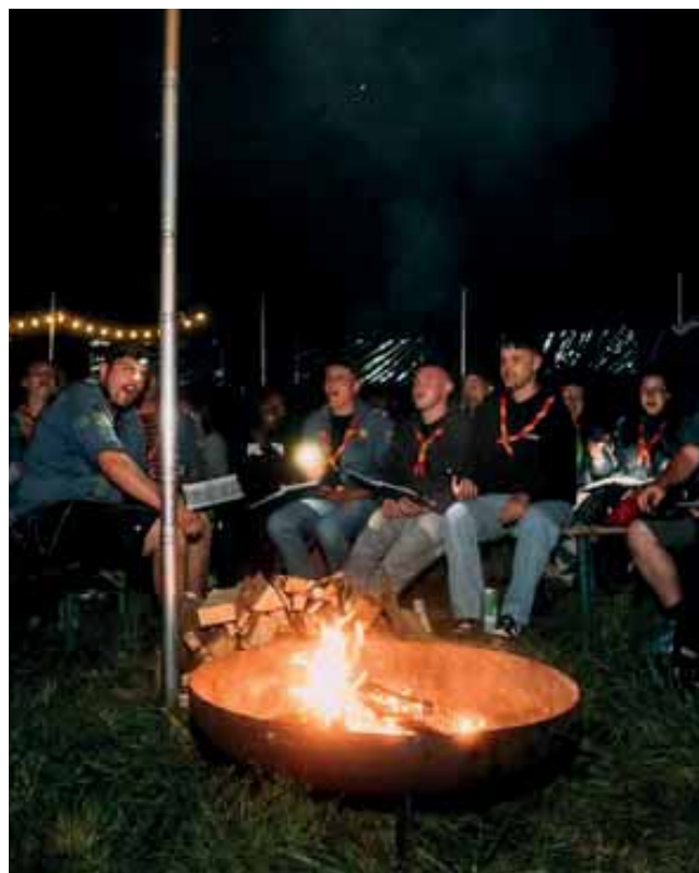
Ein gemütlicher Abend am Lagerfeuer mit Gesang und Gemeinschaft bei der SteWa

Zu den zentralen Maßnahmen zählte die Kindermusicalwoche, bei der Kinder im Alter von 6 bis 12 Jahren gemeinsam ein Musical einstudierten und am Ende der Woche öffentlich aufführten. Die Teilnehmenden übernahmen unterschiedliche Rollen, sowohl auf, als auch hinter der Bühne und sammelten dabei Erfahrungen in den Bereichen Teamarbeit, Kreativität und Selbstvertrauen. Die Abschlusssaufführung bot den Kindern eine wert-schätzende Plattform, ihre Ergebnisse zu präsentieren.