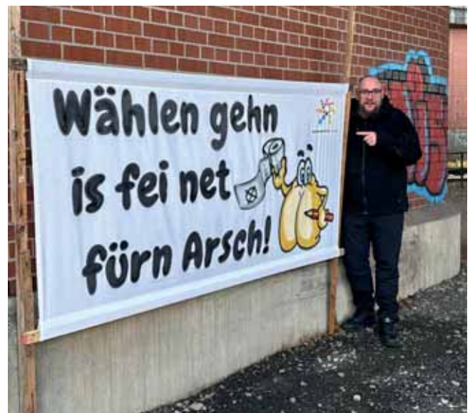
Plakat der Aktion „Wählen gehn is fei net fürn Arsch!“