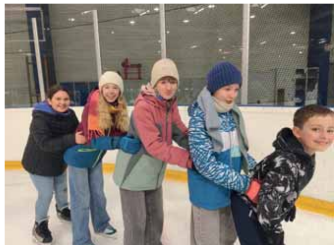
Kinder beim Eislaufen