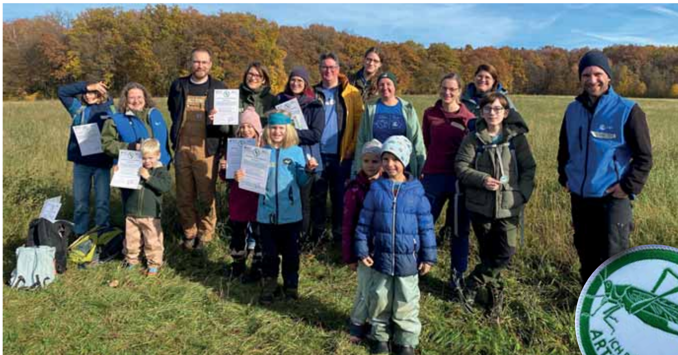
Alle legten erfolgreich die Prüfung des „Heupferdchens“ ab – ein Zertifikat als Einstieg in die Artenkenntnis

Die NAJU ist die eigenständige, gemeinnützige Jugendorganisation des Landesbundes für Vogel- und Naturschutz in Bayern e. V. (LBV) mit ca. 12.000 Mitgliedern. Die etwa 130 Kinder- und Jugendgruppen sowie 10 LBV-Hochschulgruppen engagieren sich für den Erhalt der Umwelt und sind sowohl vor Ort als auch bayernweit aktiv.