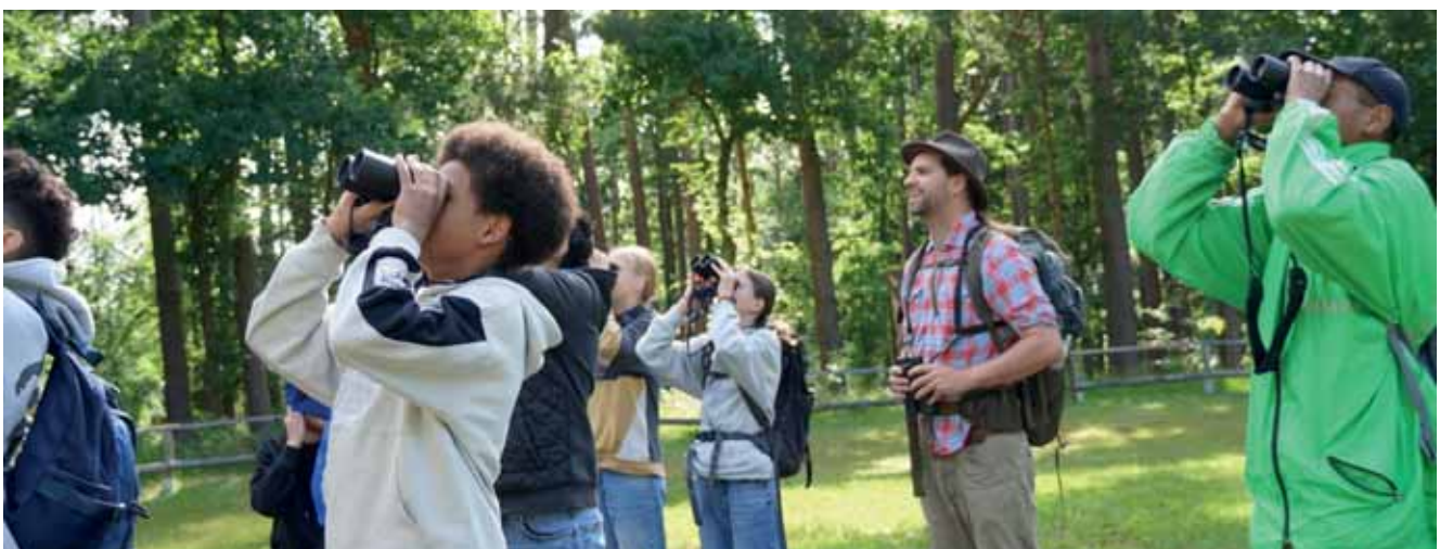
BioDiv Camp 2025