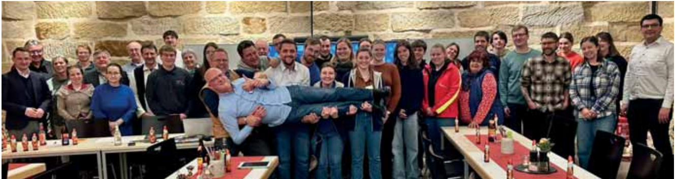
Die Delegierten bei der Vollversammlung im Herbst 2025

2025 – ein Jahr mit neuen Ereignissen, Rekordzahlen und Altbewährtem. Eine erste rekordverdächtige Veranstaltung war unser alljährliches Fotorätsel mit 1.570 beteiligten Schüler:innen.