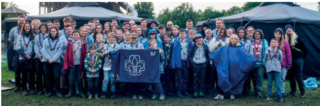
Gruppenbild Pfingstlager 2025