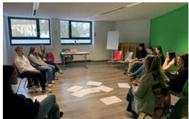
Workshopangebot für Schüler:innen