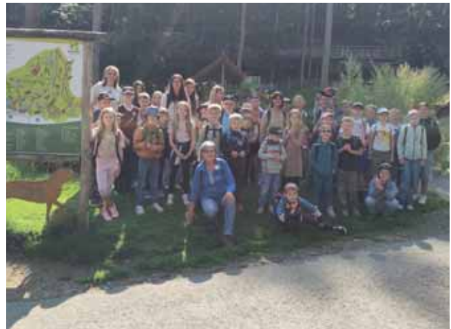
Gruppenfoto aus dem Wildpark