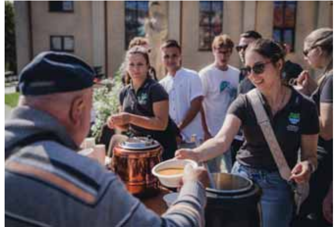
Ausgabe von Gemüseintopf beim DPJW-Jugendpreis-Projekt in Kielce/Polen

Vor der Bundestagswahl im Februar hatten wir bereits in Zusammenarbeit mit dem Bund der Selbstständigen eine Podiumsdiskussion mit den Erwachsenenverbänden organisiert. Im Fokus standen die Bundestagskandidat:innen aus dem Wahlkreis Bayreuth. Neben der Organisation und inhaltlichen Mitgestaltung waren wir außerdem mit unseren Wahlforderungen (online zu finden unter www.landjugend.de/mitmachen/wahlforderungen ) an einem Stand vertreten.