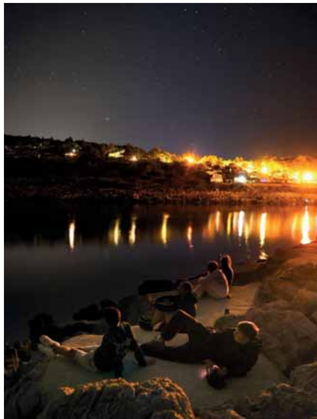
Ein Abend bei der Auslandsfreizeit

Eines der besonderen Highlights des Jahres 2025 war das Freizeit-Planungswochenende Anfang April. Dabei waren vier Freizeitteams anwesend und mit der Planung der jeweiligen Freizeit beschäftigt. Neben den Planungsphasen gab es immer wieder Zeiten für Austausch, Spiel und Spaß. Das Wochenende war ge-