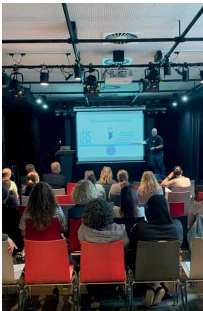
Frühjahrsfachtagung für das pädagogische Personal im Ganzttag