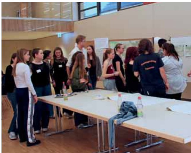
Jugendliche gestalten die Zukunft im Markt Igensdorf mit