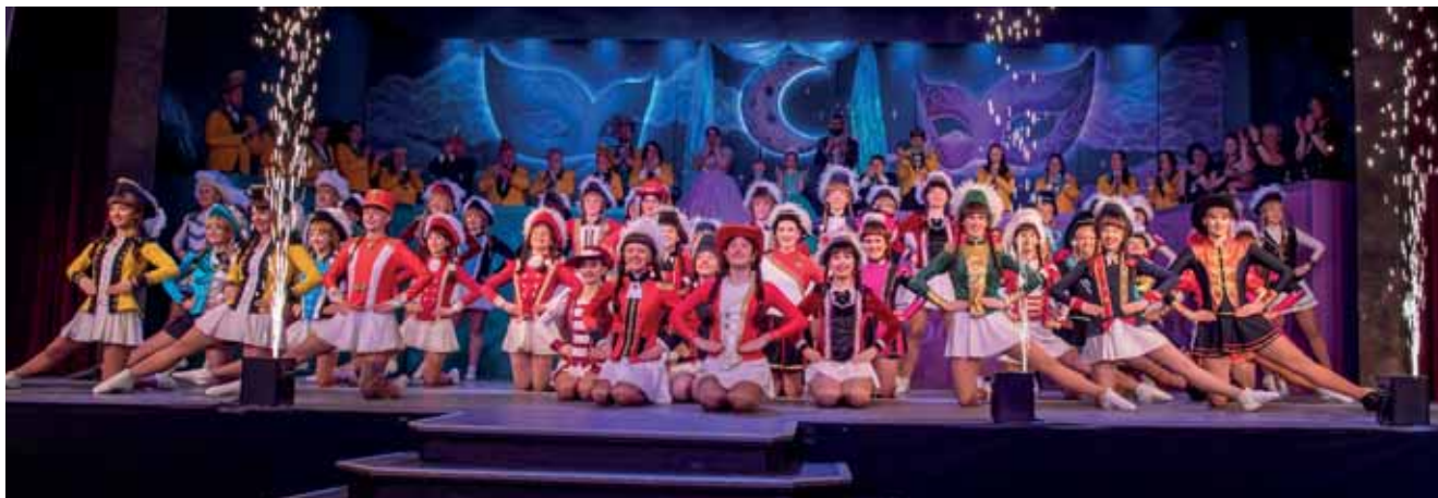
Oberfranken Garde bestehend aus 30 verschiedenen Vereinen