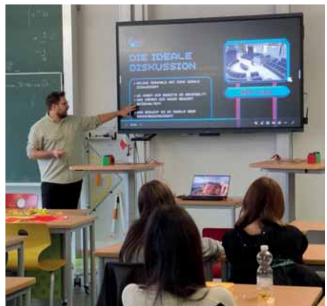
„Democracy Machine!“ am Frankenwald-Gymnasium Kronach