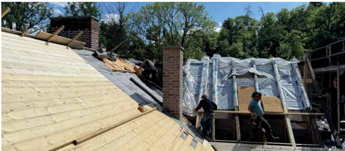
Dachsanierung Pfadfinder Centrum Callenberg