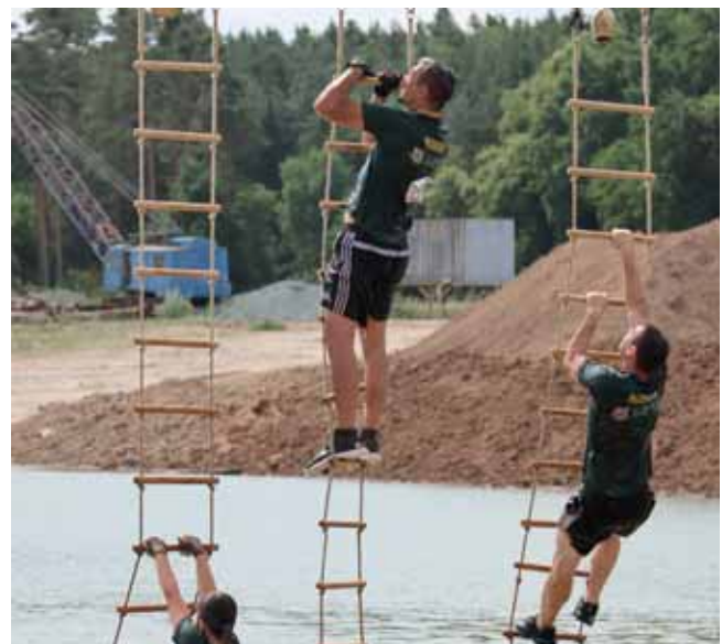
Gemeinsam galt es beim Matschlauf einige Hindernisse zu überwinden