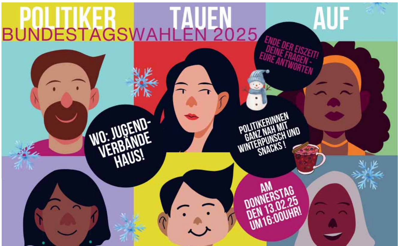
Flyer zur Aktion „Jede Stimme zählt“