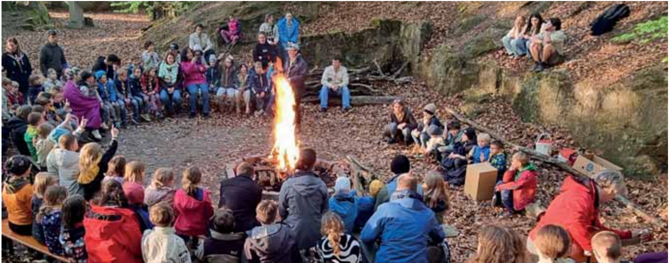
Die jungen Forscher:innen bei der Forscherfreizeit im Mai am Lagerfeuer

Auch das vergangene Jahr war geprägt von lebendiger Gemeinschaft, geistlicher Tiefe und erlebnisreicher christlicher Jugendarbeit. In allen Aktionen wurden junge Menschen darin gestärkt, sich selbst, andere und Gott bewusster wahrzunehmen und im Glauben zu wachsen.