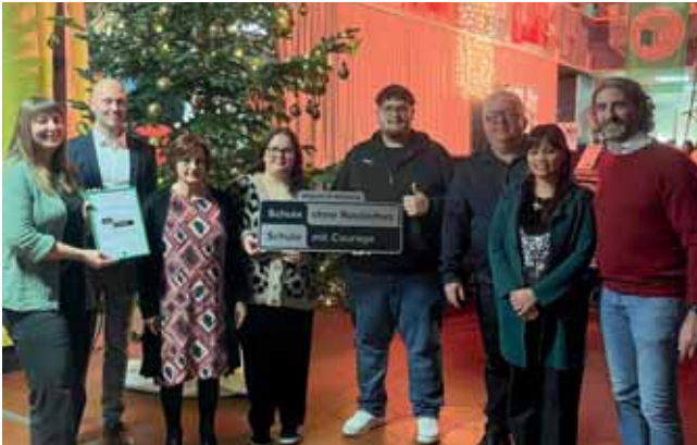
Graf-Stauffenberg Realschule, Bamberg