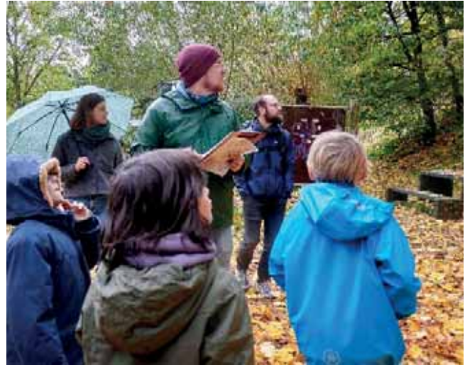
Kinder und Betreuer:innen bei einer Freizeit