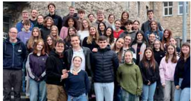
Teilnehmer:innen des SMV-Bezirksseminars 2025

Am Samstagmorgen starteten wir nach dem Frühstück mit einem Warm Up in den Tag, woraufhin der erste zweier Workshopblöcke anstand. Das Leitungsteam hatte für diesen Tag mehrere Workshops vorbereitet, von denen die Teilnehmenden zwei besuchen konnten. Zur Auswahl standen die Themen Rhetorik, Netzwerke außerhalb der SMV, Öffentlichkeitsarbeit, Digitalisierung, Motivation & Reflexion in der SMV sowie ein Planspiel zum Thema Projektmanagement.