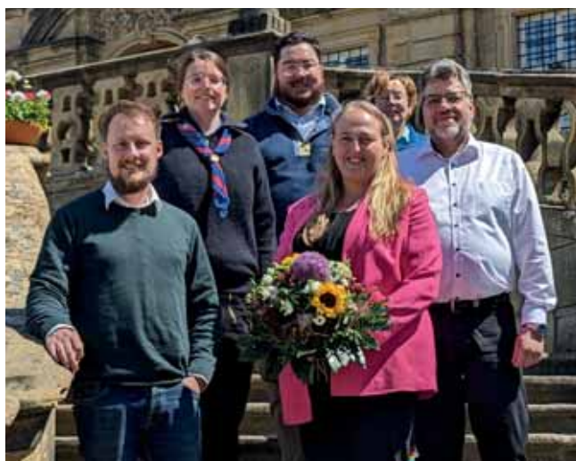
Der Vorstand des Bezirksjugendrings im Frühjahr 2025

Liebe Vertreter:innen der oberfränkischen Jugendverbände und Jugendringe, liebe Mitarbeiter:innen der oberfränkischen Jugendarbeit, sehr geehrte Damen und Herren,